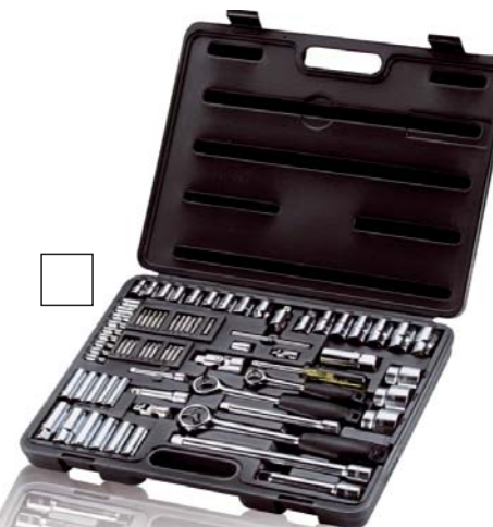
Zestaw kluczy nasadowych Stanley 75 elementów